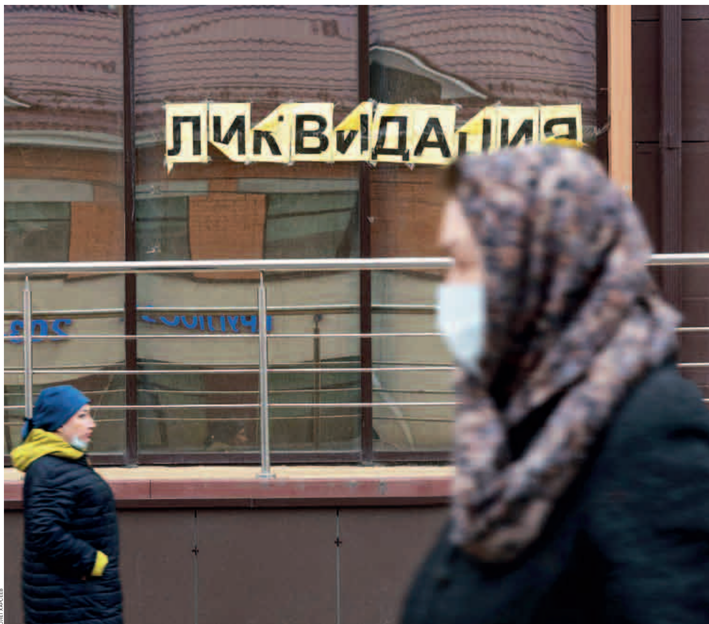
Ограничения, связанные с распространением коронавируса, не коснулись только третьих малых предприятий, остальные понесли убытки

По словам эксперта, находясь на самоизоляции, люди стали чаще совершать покупки в интернет-магазинах, поэтому многие предприниматели начали перестраивать свои бизнес-процессы и активно внедрять дистанционные сервисы для своих клиентов. Так, спрос на услуги по организации онлайн-оплаты в апреле-мае вырос на 40%. «Я уверен, что сейчас переход на дистанционные услуги — оптимальный вариант для того, чтобы поддержать свой бизнес. Также в соответствии с рекомендациями Центрального банка России для ряда отраслей с середины апреля банки предлагают сниженную ставку по интернет-эквайрингу — 1%. Этот фактор также существенно простимулировал бизнес, позволяя сократить свои расходы на организацию приема платежей онлайн», — добавил Андрей Третьяков.