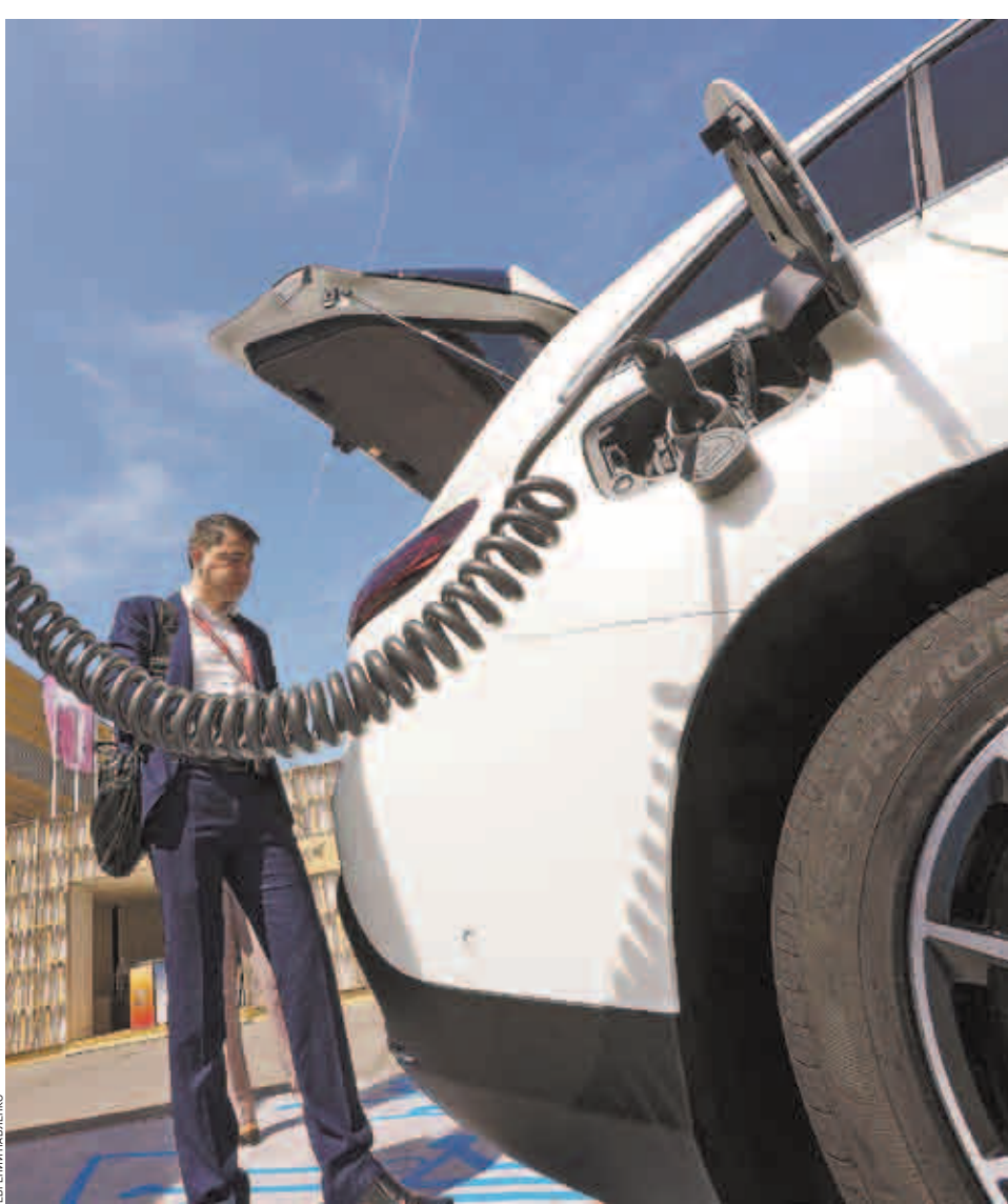
Сибирь является лидером по количеству сделок по продаже б/у электрических автомобилей

Стоимость Nissan Leaf 2020 года выпуска под заказ в Новосибирске обойдется в 3,5 млн руб. Подержанная модель Nissan