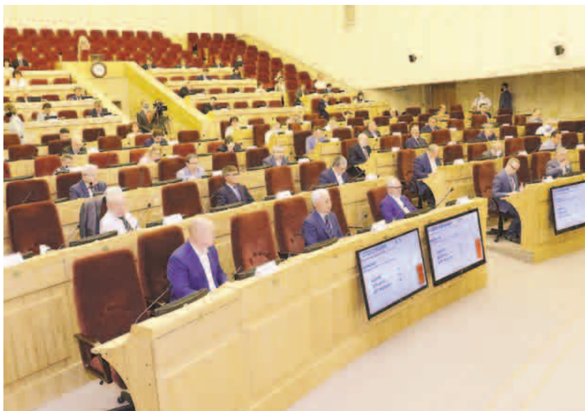
В рамках принятых шестым созывом инициатив в регионе было возведено в два раза больше инфраструктурных комплексов и объектов в сравнении с периодом деятельности пятого созыва