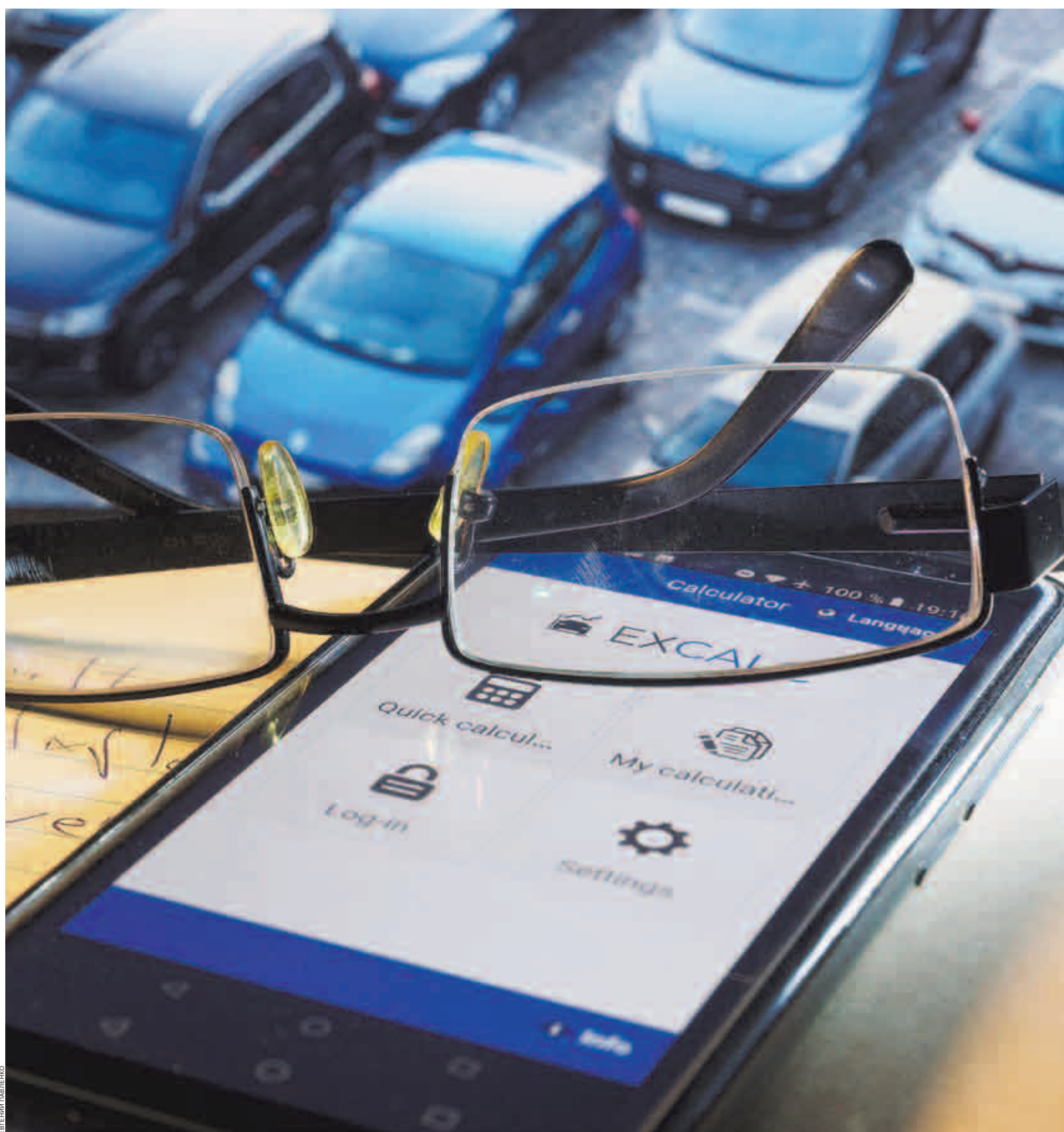
Крупные дилерские центры в период введенных мер по борьбе с коронавирусом осваивали дистанционную продажу

Рынок сильнее просел в апреле, но летом стал вновь набирать обо-