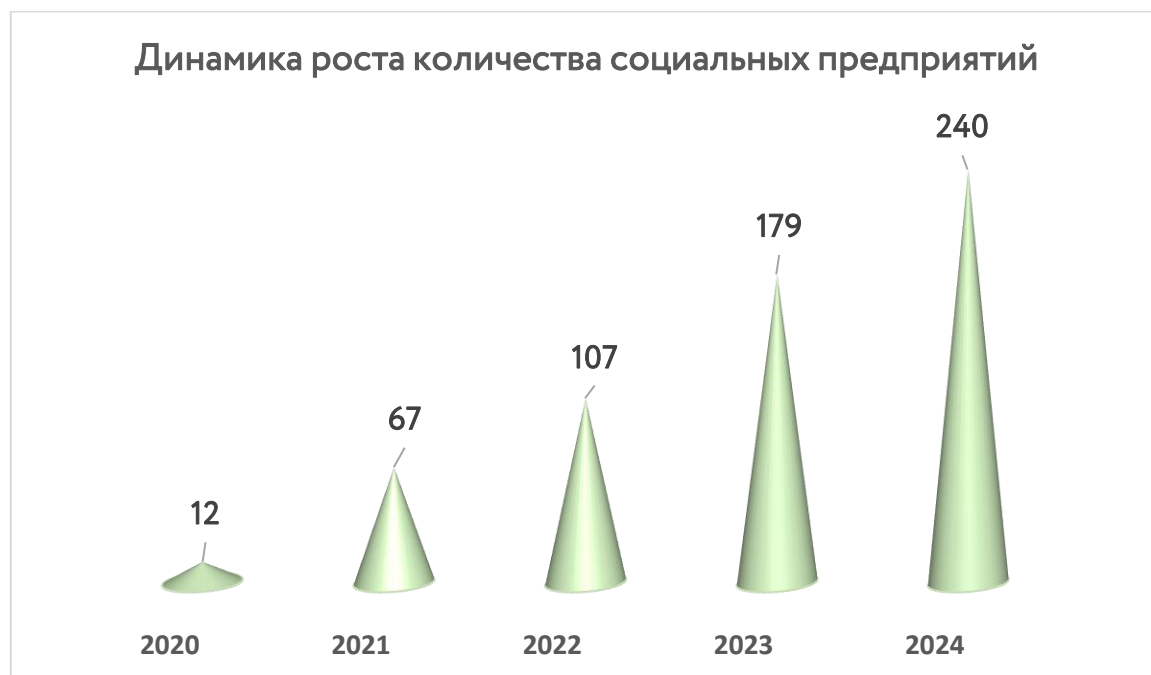
Рисунок 2. Статистические данные

По данным статистики ЦИСС социальные предприятия активно пользуются мерами государственной поддержки. Так по итогам 2020 - 2024 годов: